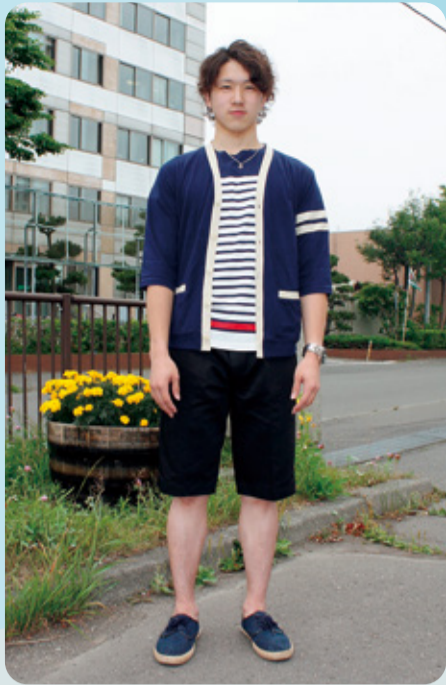
優しい顔立ちとは裏腹に、胸板ががっちり厚い!さすがスポーツマンです