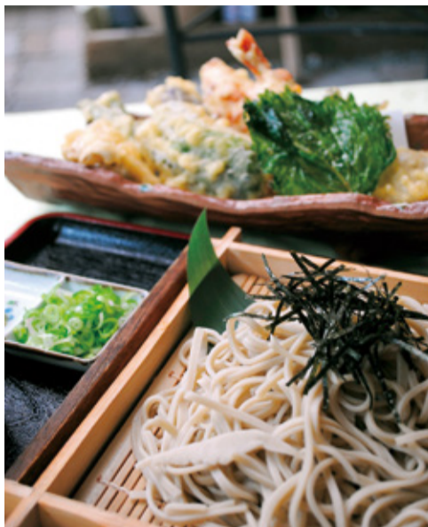
「天ざる」(1040円)。揚げ立てのエビや地元野菜の天ぶらが8、9点。そばとともに大満足の一皿

そば以外に「ピリ辛ごまニララーメン」(680円)など、長年の経験を生かしたメニューも人気。夫婦2人で営業しているので、混雑時は多少の待ち時間覚悟の上で。予約可。