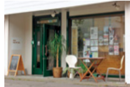
店内では、定期的にあコースティックライブが行われる

表町3-2-2 ☎82-7113 月～金曜午前11時～午後2時 月～土曜/パーティタイム午後10時～午前3時 日曜定休