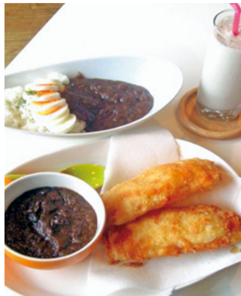
写真奥「特製ポークカレー(ライス)」「青空カレー」(各550円)。バナナミルクジュース(400円)

フードメニューは持ち帰りもでき、事前に電話で予約すれば、近隣なら5個以上で配達も可能。夜は一転、大人の雰囲気。仕事帰りにカクテル(700円)を楽しむのもいい。