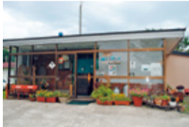
「とまこむ見たよ」で食事の方全員100円引き(9月末まで)

白老町北吉原401-149 ☎83-3456 午前11時～午後3時、午後5時以降は2人以上の予約のみ営業 水曜定休