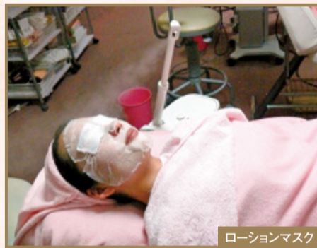
ローションマスク

③肌に潤いを与えるマッサージを5分したあと、引き締め効果のあるローションマスクを5分間。アイクリームを付けて終了。