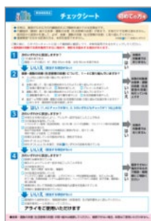
購入時チェックシート (イメージ)