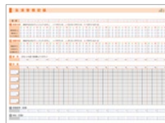
生活習慣記録シート (イメージ)