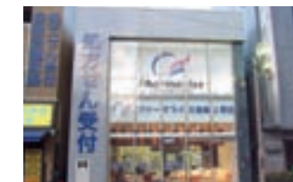
ファーマライズ薬局 上野店