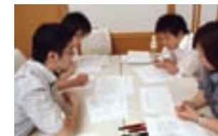
リーダー人財育成プロジェクト

持続的に成長するためにはリーダーとなる人材の育成が不可欠です。当中間期も若手選抜型の集合研修である「リーダー人財育成プロジェクト」を実施しました。本研修の目的は、薬学医療に関する専門的な知識の習得ではなく、現場のリーダーとしての資質を磨くことにあります。その内容は、①課題解決のための能力開発、②コミュニケーションの能力開発、③財務計数の把握に関する能力開発等、総合マネジメントの分野に焦点を絞っています。