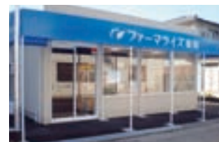
ファーマライズ薬局 魚津店

当中間期において、ファーマライズグループの店舗総数は27店舗増加し155店舗になりました。昨年9月の連結子会社2社（株式会社三和調剤（3店舗）、株式会社ハイレンメディカル（22店舗））の増加に加え、10月に魚津店（富山県）、11月に一宮西店（愛知県）を新規開局いたしました。なお、12月以降についても上野店（東京都）を新規開局し、有限会社北町薬局（3店舗）の連結子会社化も行っております。